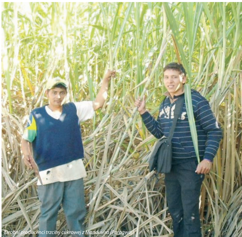
Drobni producenci trzciny cukrowej z Manduvira (Paragwaj)